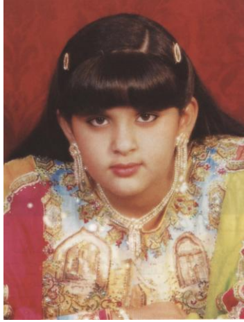
سمو الشيخة (لطيفة بنت محمد بن راشد آل مكتوم) أول شيخة من الإمارات تظهر في أغنية وطنية خاصة بالأطفال