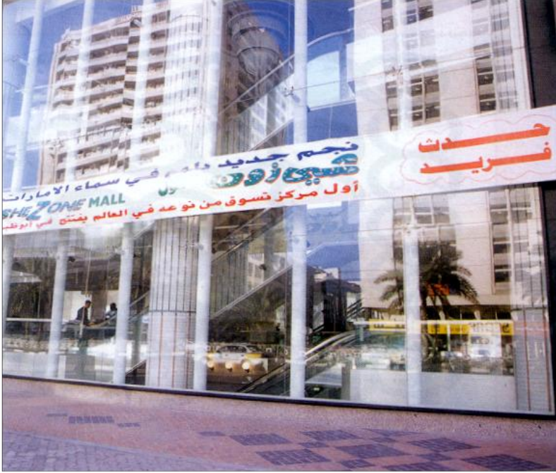
أول إماراتيه مديرة مبيعات فندق

في أبو ظبي، ويتكون من أربعة طوابع ويوفر كافة متطلبات المرأة والأسرة العصرية.