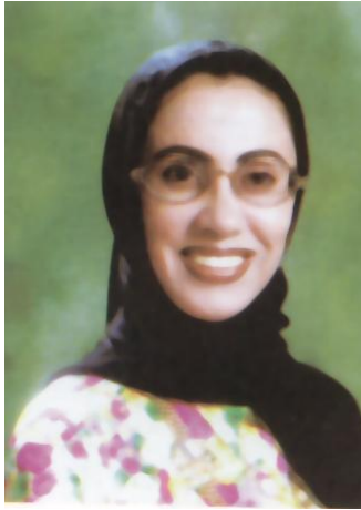
(مريم محمد الرومي)

❖ أول مواطنة يتم تعيينها كوكيل وزارة مساعد في دولة الإمارات العربية المتحدة هي الدكتورة عائشة السيّار في عام ١٩٨٢م، فهي أول وكيل مساعد لوزارة التربية والتعليم والشباب لدائرة الخدمة الاجتماعية ثم وكيل مساعد لقطاع التخطيط. وكانت قد تخرجت من كلية البنات جامعة عين شمس وحصلت على درجة الماجستير في التاريخ عام (١٩٧٤م) ثم درجة الدكتوراه وهي أول إماراتية تحصل على هذه الدرجة.