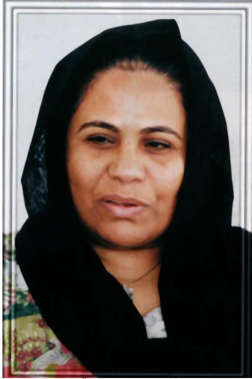
أول شرطية في الفجيرة

الشرطة، وتعتبر بذلك أول إماراتية تدخل الشرطة النسائية، وهي حالياً متفرغة للإعلام منذ عام ١٩٨١م.