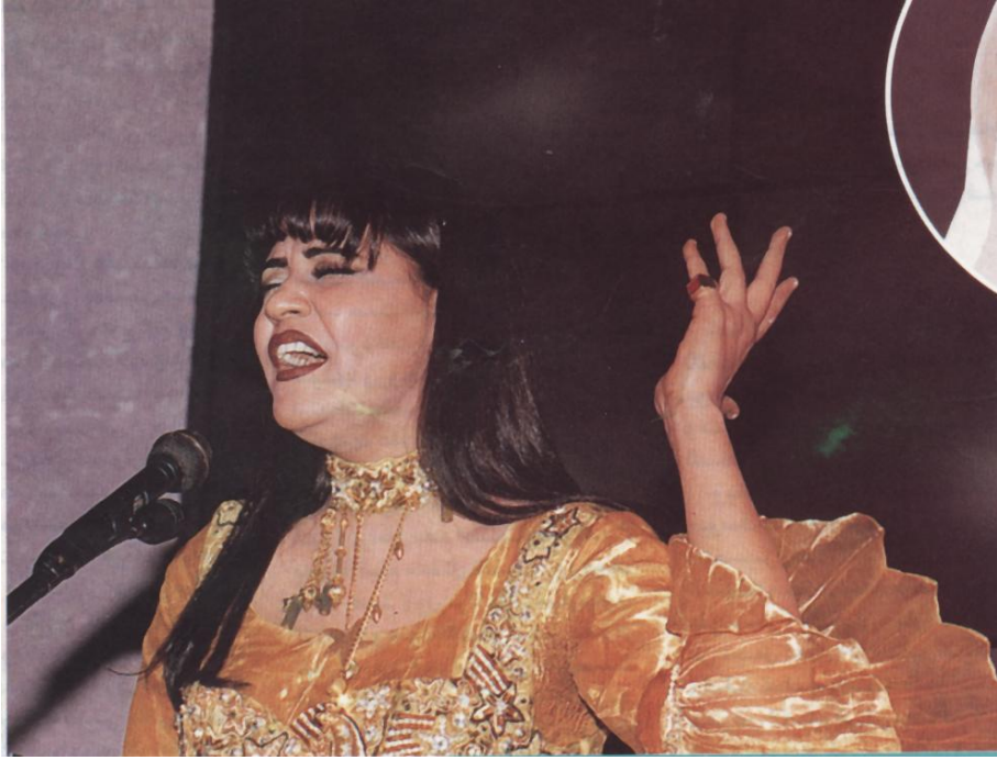
الفنانة (أحلام) أول مطربة عربية تغني في فلسطين

❖ أول مطربة عربية تدخل إلى فلسطين وتغني في رام الله هي الفنانة الإماراتية "أحلام" وذلك في عام ١٩٩٩م.