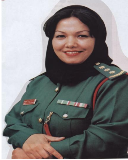
النقيب الدكتورة (فوزية عبد العزيز طه الشامري) أول إماراتية دكتورة في القانون

لدولة الإمارات والقانون المصري". وكان ذلك خلال عام ٢٠٠٠م.