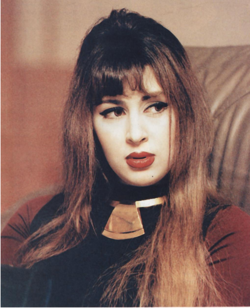
سمو الشيخة (بشرى بنت محمد) أول زوجة لحاكم خليجي يجرى معها حديث صحفي مصوّر