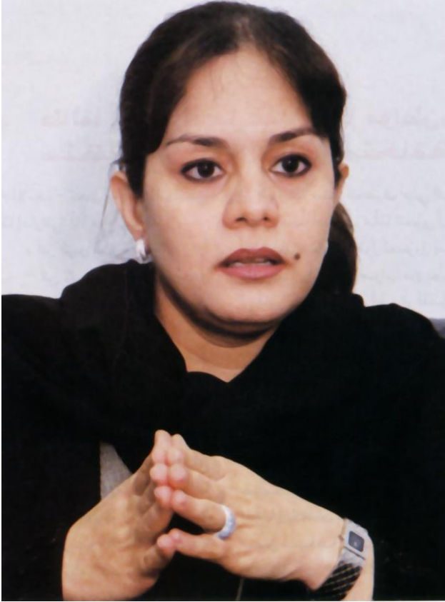
الدكتورة (ناريمان محمد شريف الملا) أول طبيبة إماراتية وصلت إلى مرتبة أكاديمية عالية