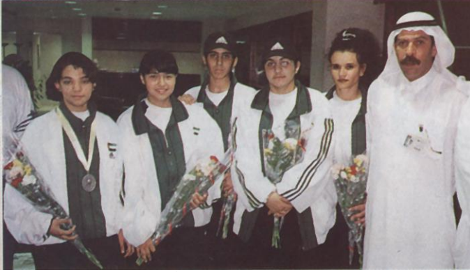
منتخب الإمارات للسيدات في الكاراتيه أول منتخب سيدات خليجي في الكاراتيه