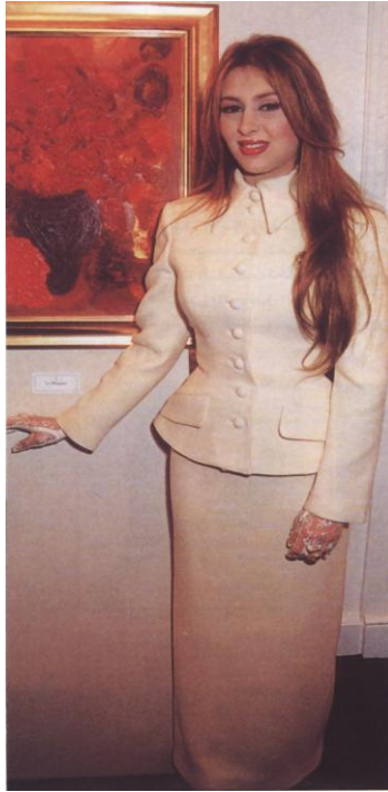
سمو الشيخة بشرى بنت محمد آل مكتوم بجوار لوحة الطبيعة في أول معرض فني لها خارج الإمارات

❖ أول معرض فني تقيمه الشيخة "بشرى بنت محمد آل مكتوم" حرم الشيخ "مكتوم بن راشد آل مكتوم"، يرحمه الله، خارج الإمارات، كان في لندن في "غلو سترهاوس" في شهر إبريل ٢٠٠٠م وقد قدّمت فيه ٣٠ عملاً فنياً من أعمالها، وقد خصّص ريع المعرض لدعم المؤسسة الخيرية للمساعدات الطارئة "أطباء بلا حدود".