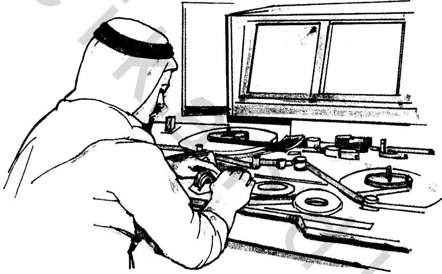
شكل (٤٩) يوضح عملية المونتاج في الأفلام المتحركة

الممثل أو المدرس، أو يحدث خلل بأحد الأجهزة الفنية ونحو ذلك. فبدلاً من العودة إلى البداية، يستمر التقاط الحدث، ثم تتم معالجة تلك المشكلات خلال عملية المونتاج (شكل ٤٩). وتمكنا تقنيات المونتاج من مزج الصورة مع الصورة الأخرى، أو مزج الصوت مع الصورة، أو إضافة مؤشرات أخرى بما يضيفي على العمل النهائي القيمة العلمية والتعليمية المطلوبة.