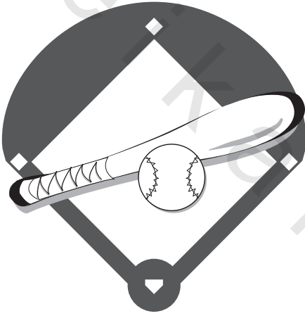
الشكل (5.1) قائمة لعبة البيسبول

قائمة لعبة البيسبول (انظر الشكل 5.1) نشاط مبني على لعبة البيسبول الشبيهة بقائمة اللائحة بمجموع عشرين خيارًا على الأقل، محددة مسبقًا. تعطى الخيارات درجات: فردية، وزوجية، وثلاثية، وتسجل الأهداف وفقًا لمستويات مصفوفة بلوم المعدلة. تمثل الخيارات الفردية مستويات التذكر والفهم، أما الزوجية فتمثل مستويات التحليل، والثلاثية تمثل