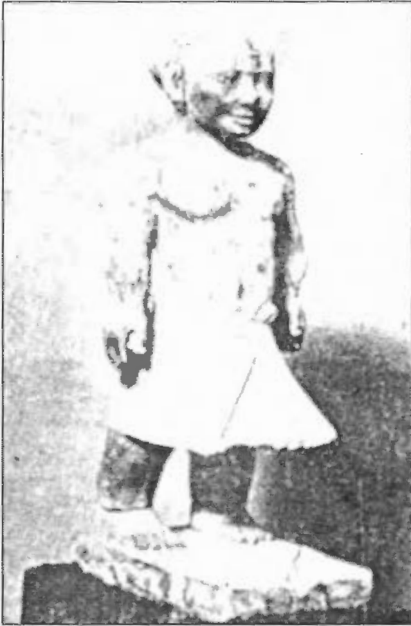
صورة رقم / ٥٢

تمثال من الحجر الجيري يمثل قزما، بمتحف القاهرة (الأسرة الخامسة).