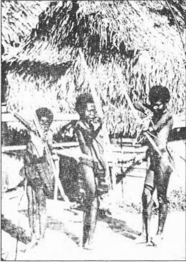
صورة رقم / ٥٢

ثلاثة شبان من الأقزام الزوج يحملون اقواسهم وسهامهم