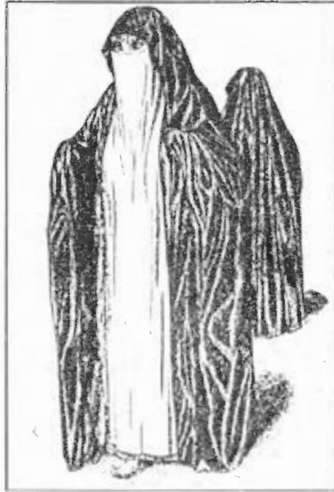
صورة رقم / ٣٨

رجال يتناولون الطعام. وقد وقف أحد الخدم يحمل قلة بها ماء بينما أمسك الخادم الآخر مذبة مصنوعة من السعف لطرد الذباب