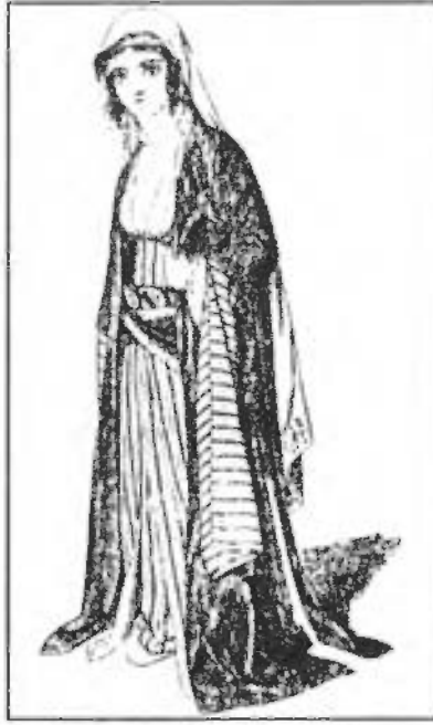
صورة رقم / ٣٩ : سيدة ترتدى ملابسها الخاصة بالبيت