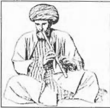
صورة رقم / ٤٤