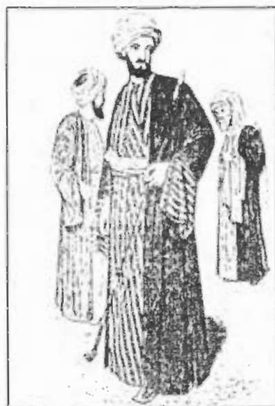
صورة رقم / ٣٦ رجال من الطبقتين الوسطى والعليا