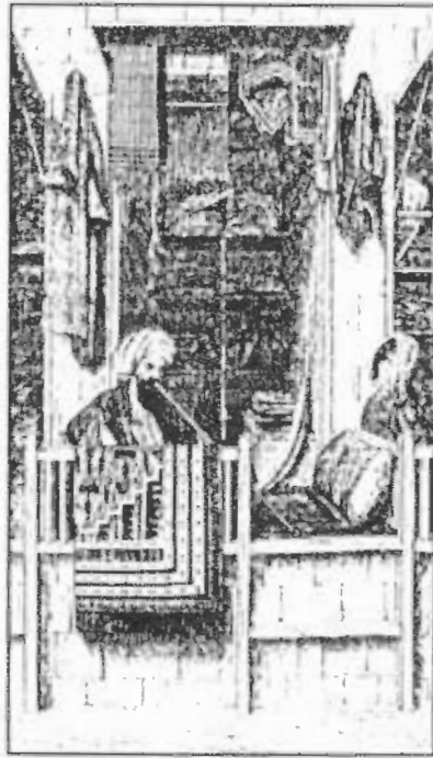
صورة رقم / ٤٢