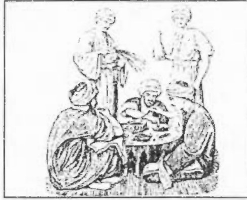
صورة رقم / ٣٧

رجال يتناولون الطعام. وقد وقف أحد الخدم يحمل قلة بها ماء بينما أمسك الخادم الآخر مذبة مصنوعة من السعف لطرد الذباب