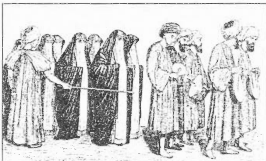
صورة رقم / ٤١ زفة العروسة