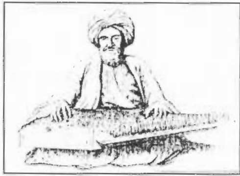
صورة رقم / ٤٣