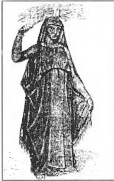
صورة رقم / ٤٠ : امرأة من مصر العليا