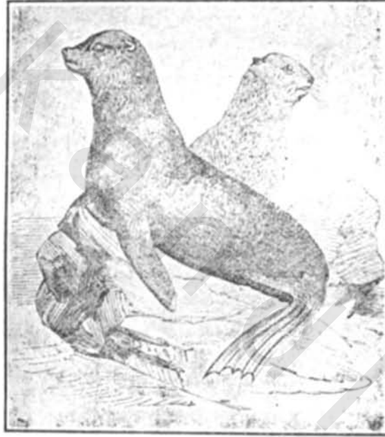
ش ٥٦ : الفقمة

من الاسماك نوع يشبه الانسان بوجهه نعي الفقمة وهي تشبه الانسان باستدارة وجهها وينبت حول فمها شعر يقربها من شبه الانسان . وهي التي يزعمون انها حيوان نصفه سمكة والنصف الآخر انسان وهذه صورته