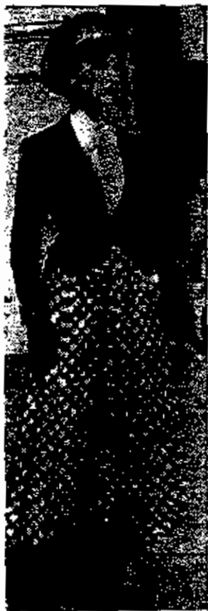
شكل - •