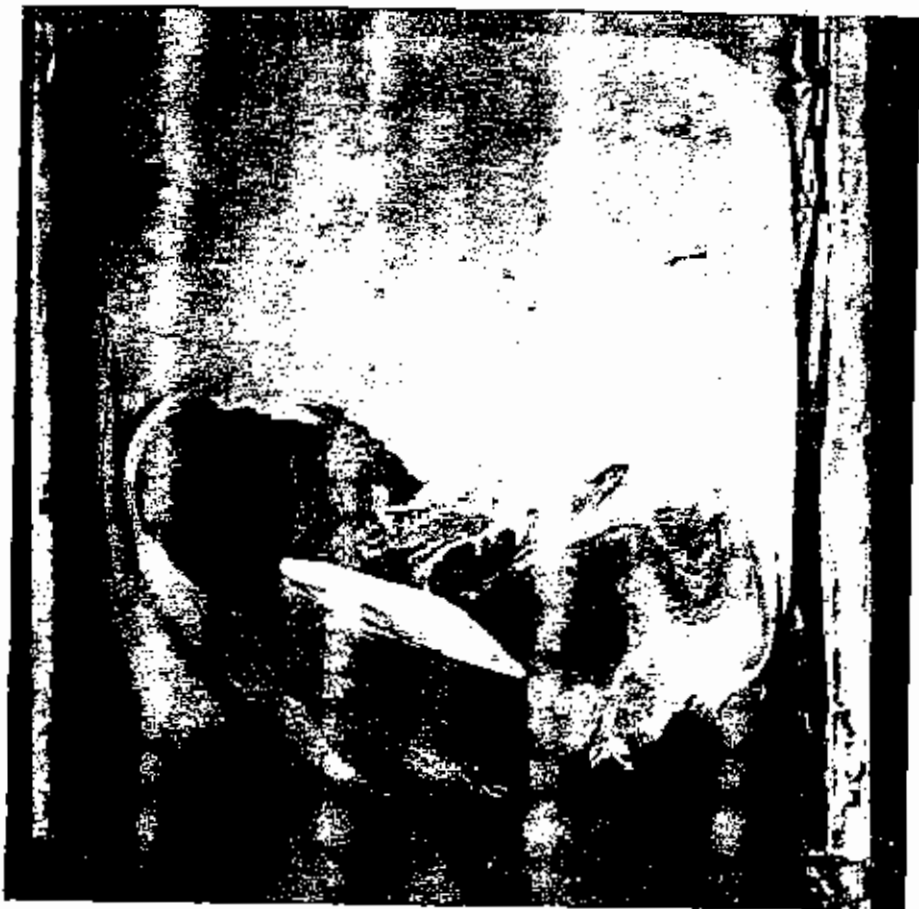
صورة راحة اذنق — تصور برتباخ