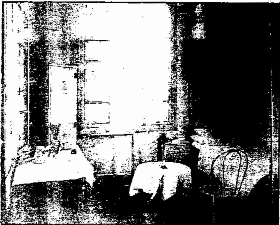
أحدى غرف المعج