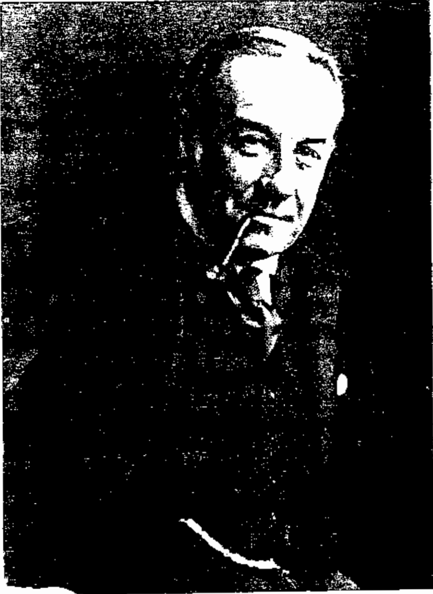
ستانلی ہارڈویں زعمیم المحافظین البریطانیین