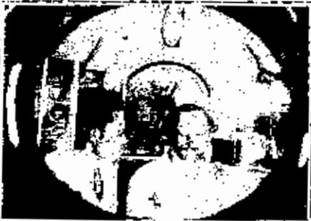
مصوره بكار وصاحبه البكر ديم في كورنيش فاس من قبله الزوارك