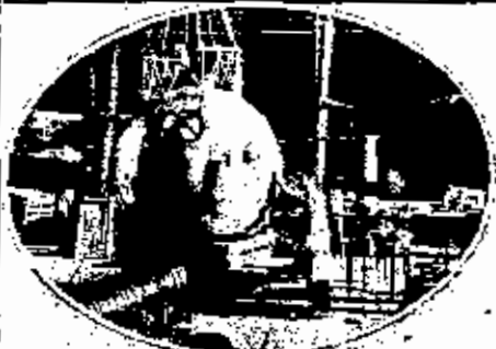
منارة الكرة الطائرة بالبريد، يظهر من خلال جدران من الخشب والخرق في كورنيش فاس