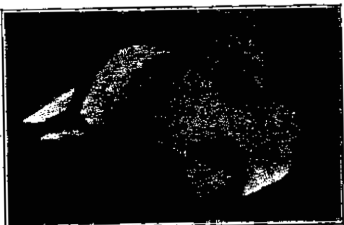
الدوق موريس ده برودي أخو البرنس لويس وصفيو اكاديمية العلوم باريس متحفظ بيراز ١٩٣٠