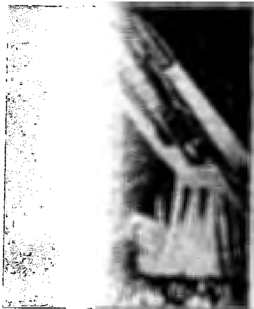
صورة مبنية على ألحان تمثل قيام القيامة