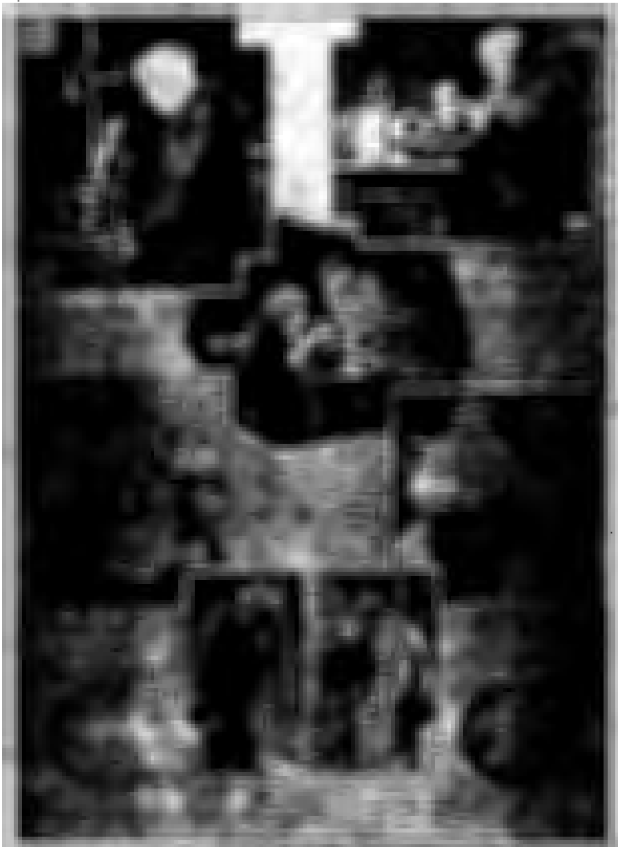
صور لادبسن في مواقف مختلفة تقلا عن مجلة الازنام الاميركية