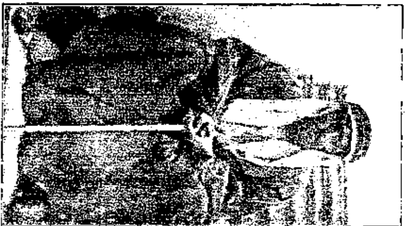
ابن الرجايع خلال سنة المحمدية