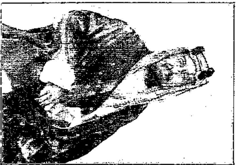
مجلسه السلطان ابن سعود