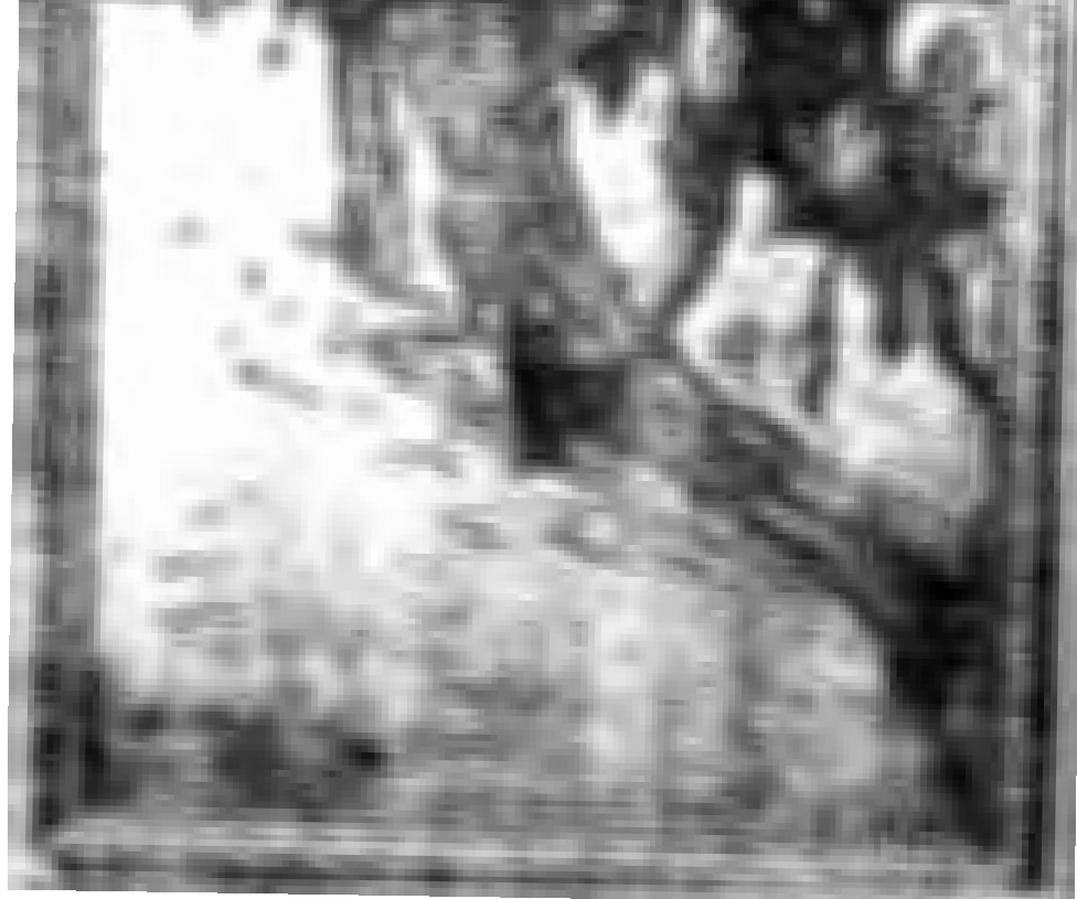
سورة ( و ر ه لاهرام ) لمسبو جون راب ابتاعتها وزارة المعارف العمومه