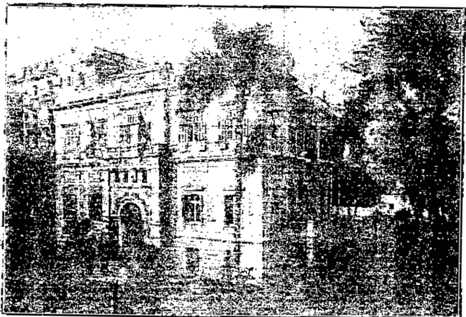
سراي جنية عجمي اننون الجميلة التي اقيم فيها معرض ١٩٢٨ متحف فرار ١٩٢٨ — انظر صفحة ١٨٧