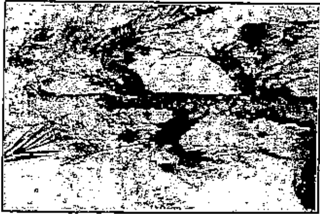
أعلى النخلة والتفروع المشجرة مختلف أكتوبر ١٩٢١ أمام الصفحة ٣٨٨