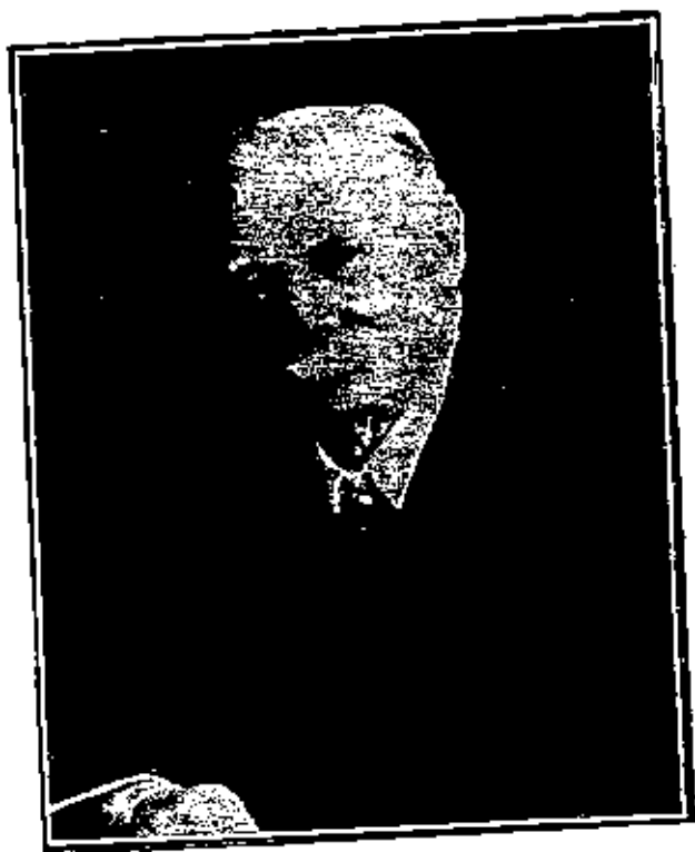
السردورد نورب رئيس مجمع تقدم العلوم البريطاني مقتطف نوفمبر ١٩٢١ امام الصفحة ٤١٧