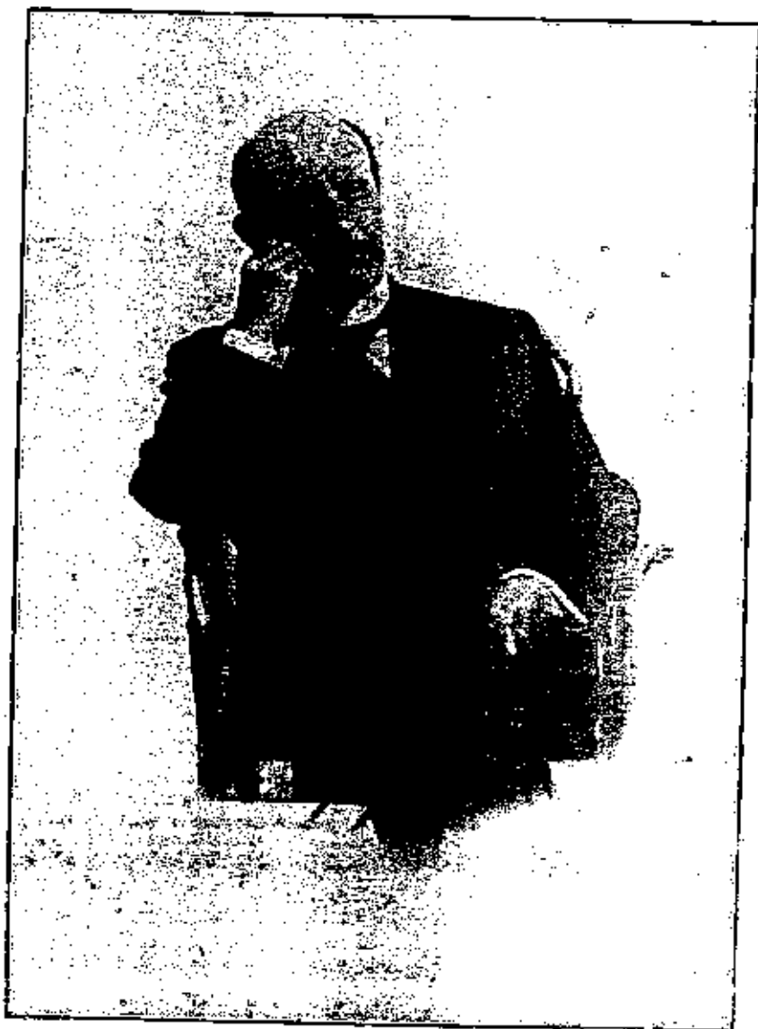
المرحوم الدكتور يعقوب صروف قبيل وفاته