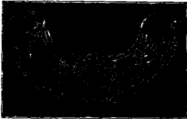
طوق من الذهب وجد في جيل

نقش الفراعنة على جدران هياكلهم في الكرنك باسماء المدن السورية والفلسطينية التي افتتحوها ولم ينقشوا اسم مدينة جيل المعروفة في العصور القديمة باسم يلوس . لكن ذكرها ورد فيها كتب عن آلهة جيل التي كان المصريون يحترمونها أو