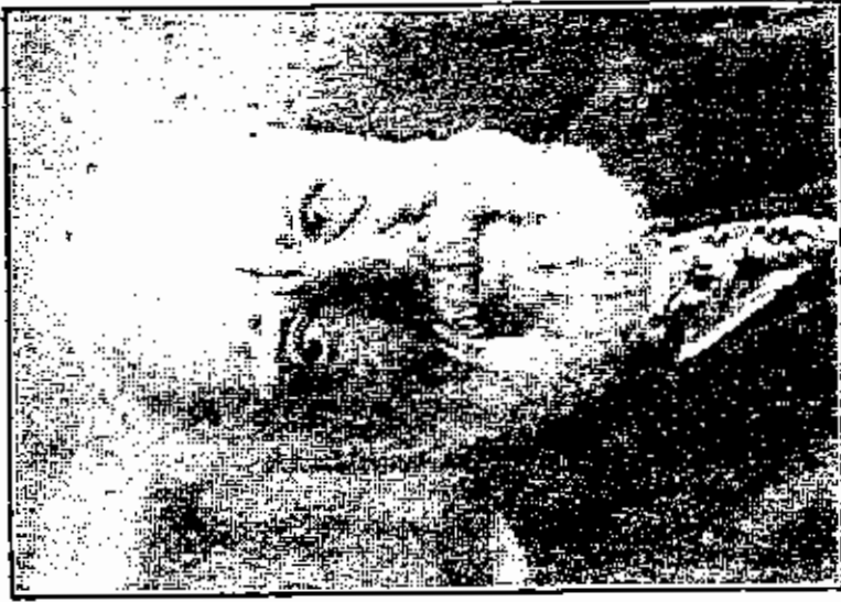
الدكتور غورالم بل