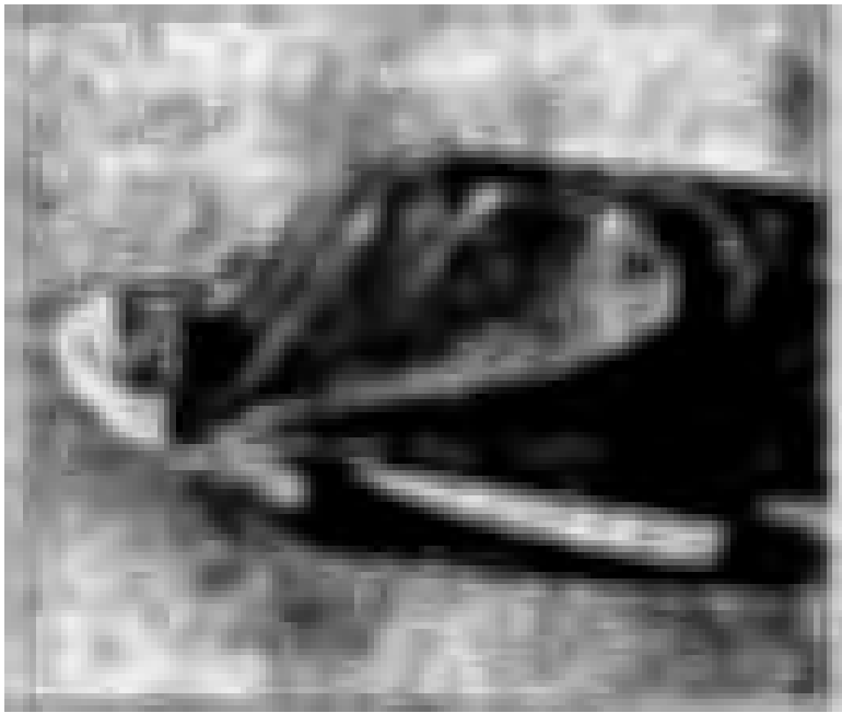
امراة فارسية متأزرة