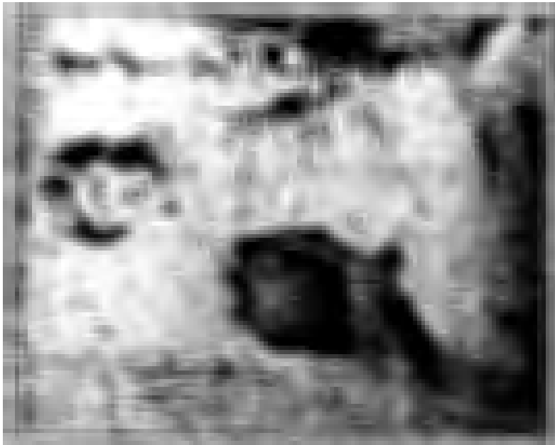
امراة فارسية بلباس البيت تدخن النارجليه