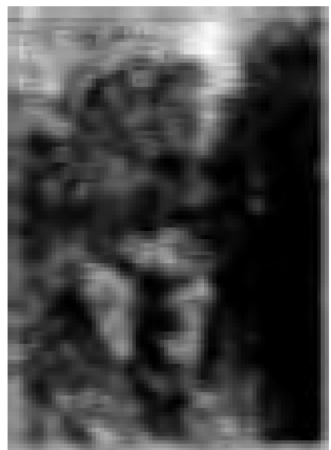
صورة للمستركولج نقلت باللاسلكية

انشأنا في مقتطف يوليو سنة ١٩٢٤ مقالة موضوعها نقل الصور بالتلفون السلكي ووصفنا الاستنباط الذي يجعل ذلك مستطاعاً ونشرنا صورة المستر كولج التي نقلت من مدينة كليفلند الى مدينة