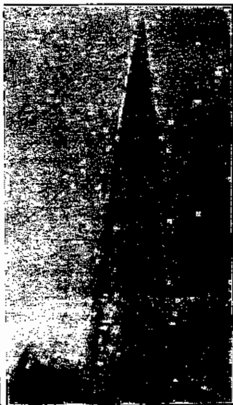
برج للمخاطبات اللاسلكية

تقيم مصلحة البريد الانكليزية محطة لاسلكية كبيرة قرب رجبي تتألف من ١٢ برجاً شاهقاً تمتد بينها الاسلاك