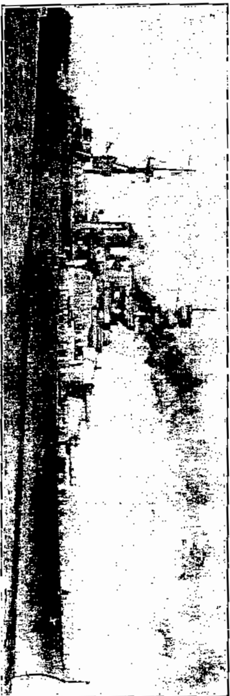
مقتطف سبتمبر ١٩١٩ العام المنقحة ١٨٠