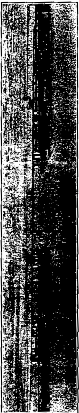
النواصة M وفيها مصنع من عيار ٢٢ بوصة