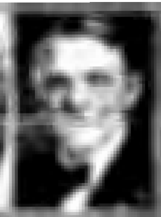
مجلس وزراء رقم الصفحة ۳۵۷