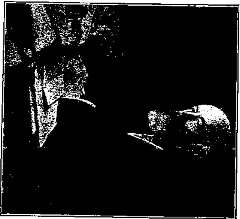
السراة المير السج