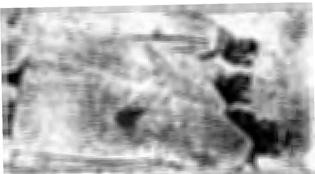
الملكة في لندن في سنة ١٨٧٢ ميلادي