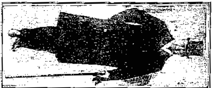
الزوجة فريديريك في الزمن في لندن