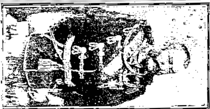
الملكة في لندن في سنة ١٨٧٢ ميلادي