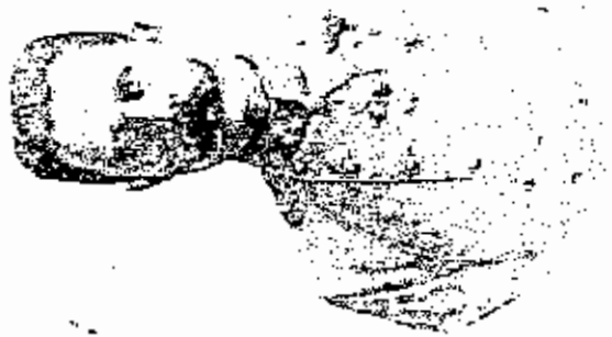
الارشيديون فرانسوا فرديناند