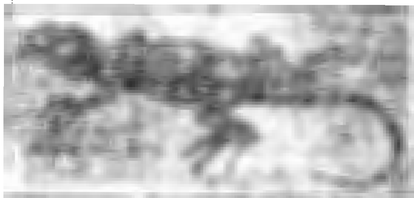
الخردون ﴿ Agama stellio ﴾

ضرب من الزحافات اعظم من العظابة واعتمت ويعرف في سيناء بقاضي الجبل ومن انواعه الخردون الا في ذكره قال ابن سيده « العصفرة ذئب واصلب منها ( اي العظابة ) وانزاعه واعظم وقيل العصفرة الفحمة المريضة وقيل هو ذكر العظابة وضرب من العظامة وليس يذكر وهو اكبر منها » . وفي لسان العرب « العصفرة ذئب يضاء ناعمة ويقال العصفرة ذكر العظامة وقيل هو ضرب من الضفادع وقيل هو ذئب يسمى السودة يضاء ناعمة انتهى » . وربما كان العصفرة هو الحيوان المسمى ( Agama ) تتد العظامة وانواعه كثيرة منها الخردون الا في ذكره