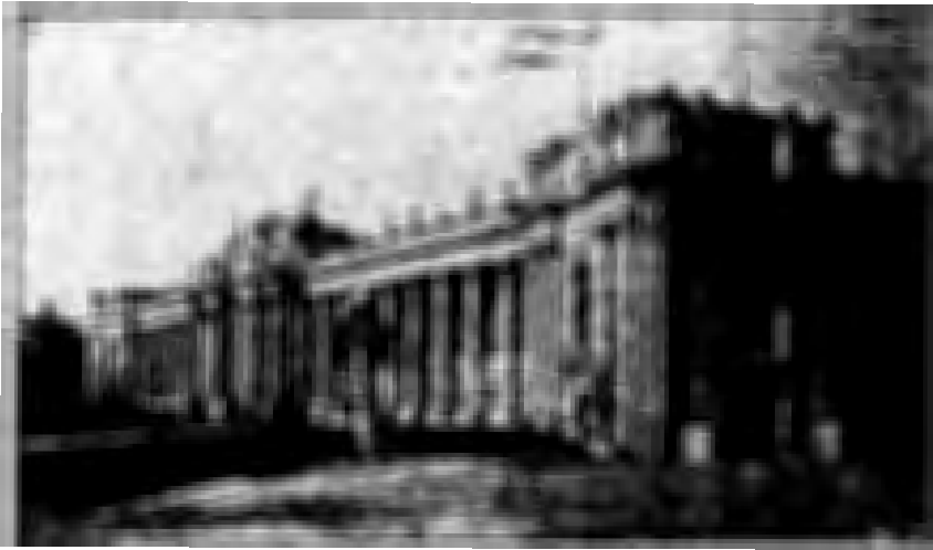
قصر التعليم من جبهة اخرى