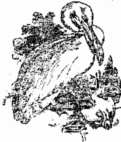
البجع او الحوصل

ابن اليطار « طائر يكون بمصر كثيراً يعرف بالكبي وهو صنفان ابيض واسود والاسود منه كرهه الواحمة لا يكاد يشتمل والايض اسوده واقوى والطيب رائحة وحرارة قليلة ورطوبته كثيرة وهو قليل البقاء وليامه يصلح للشباب وذو الامزاج الحارة ومن ينقلب عليه الصفراء » . ولم يترجمه لكلاز ( مترجم ابن اليطار ) بل ذكر في آخر الفقرة انه مجهول