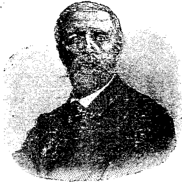
اسكار الثاني ملك اسوج ونروج