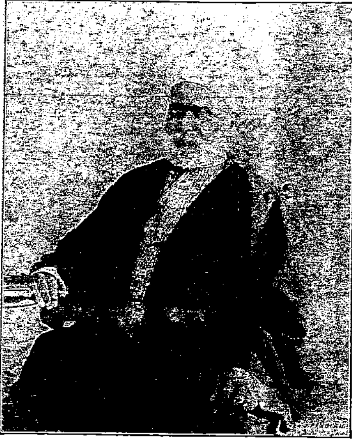
الشيخ محمد عبده مفتي الديار المصرية