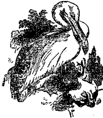
الحوصل برق برقة

واخذ الولد الطائر وعاد يوالى يتيه ويجبر ابره جناحه بجبر معوجاً ولم يعد يستطيع الطيران. واشتدت الالفة بينه وبين الولد فكان اذا ذهب للصيد يذهب معه ويعلل جرابه سمكاً ولكن اذا طرح له سمكة من سمك الهرنظر اليها شزراً وادار رأسه وعاد الى البيت مسرعاً لا يلويس على احد ولا خبر في من لا تعلم التجارب