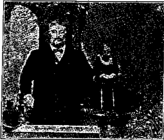
(٣) التوام بطرس الكبير

ولا شيء فيها من اخلاق الرجال . وطول خيطها نحو عشرين سنتيمتراً واذا غطتها وغطت شاربيها واظهرت وجنتيها وعينيها وحبيبتها حببتها من اجل اناء ومنه التوام المسوخ وهو توأم ممسوخ متصل بشوأم ذكر تام الخلقة جميل المنظر والممسخ انني ابلا رأس متصل باخيها من تحت القص ولها يداان ورجلان ولكن رجلها قصيرتان جداً فالجسمين رأس واحد ويظهر ان لها قلباً واحداً ايضاً وللانثى معدية يصل اليها الطعام من معدة اخيها والمرآكر العصبية يشترك فيها الاثنان . وقد ولد هذان التوامان في مدينة لكون من بلاد