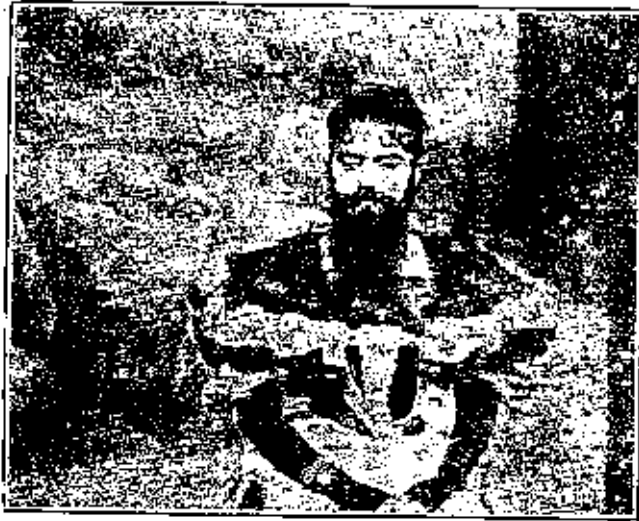
(١) في جونس امرأة ذات التية وأنثارين

من ذلك شاب مجري يفتح صدره حتى يزيد محيطه نحو شهرين و ٤١ سنتيمتراً وينفخ