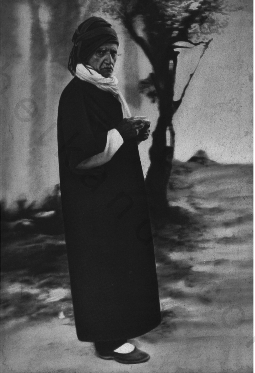
الأستاذ النورسي في جامع الفاتح إسطنبول سنة ١٩٥٢