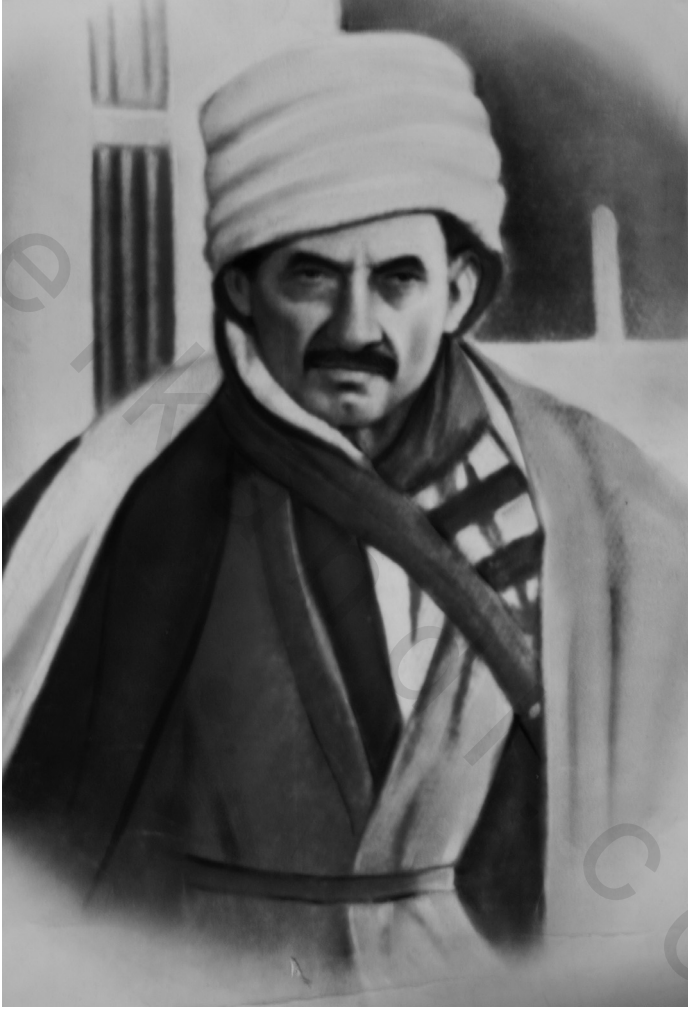
صورة الأستاذ النورسي في أيامه الأولى في بارلا التقطت بناءً على طلب السلطات