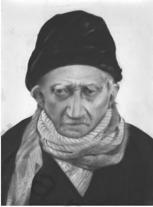
الأستاذ النورسي بعد تسميمه في سجن أفيون