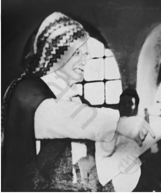
الأستاذة النورسي في أثناء دفاعه في قضية مرشد الشباب بأسطنبول في ١٩٥٢/٢/١٩