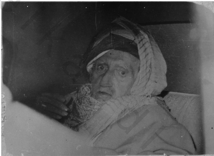
الأستاذ التركي داخل السيارة لدى مجيئه إلى إسطنبول في ١٩٦٠/١/١