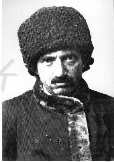
صورة الأستاذ النورسي التقطتها السلطات الألمانية لدى عودته من الأسر سنة ١٩١٨