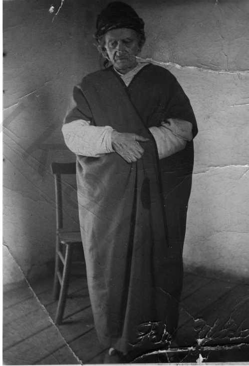
الأستاذ النورسي أيام محكمة أفيون