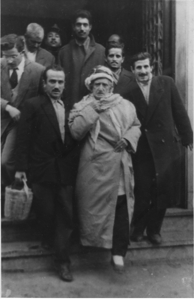
الأستاذ النورسي لدى مغادرته فندق بالاس بأنقرة يحيط به طلابه في أثناء توجهه إلى قونيا