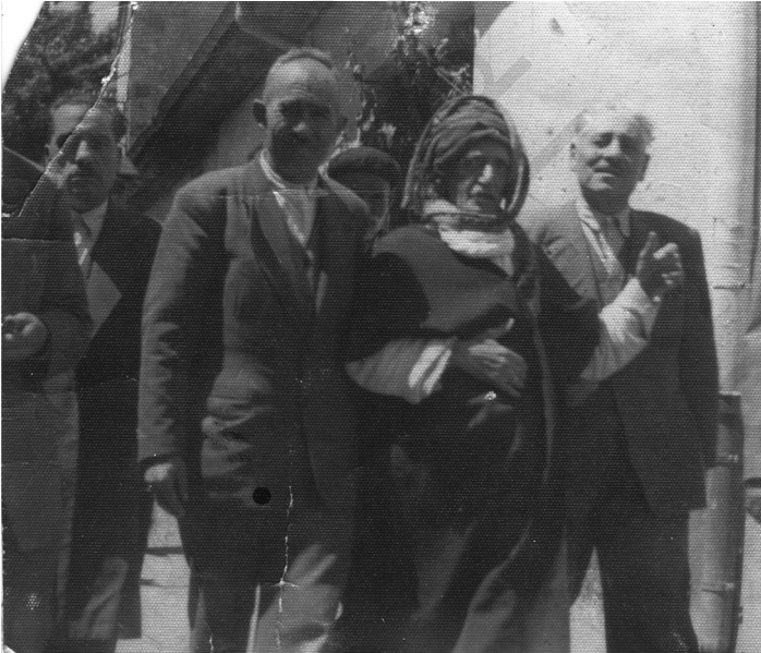
الأستاذ النورسي مع طلابه يتوجهون معاً إلى محكمة أفيون