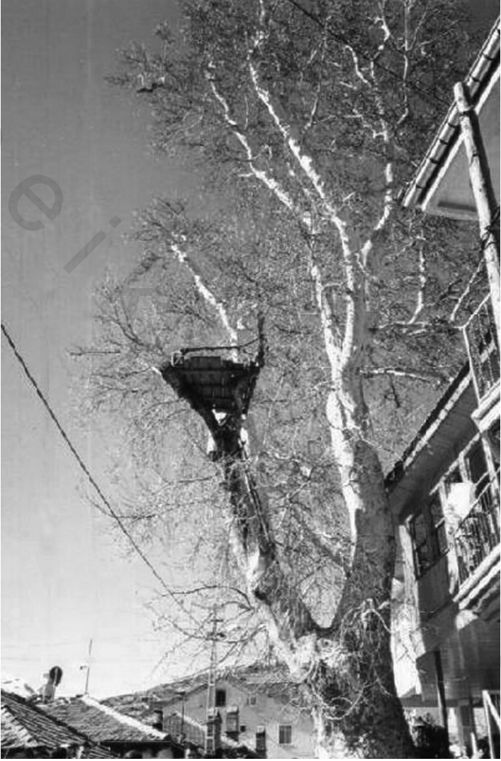
بيت الأستاذ النورسي في «بارلا» (أول مدرسة نورية) وأمامه شجرة الدلب.