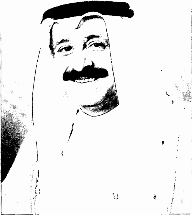
معالي الشيخ سالم صباح السالم الصباح رئيس اللجنة الوطنية لشؤون الأسرى والمفقودين